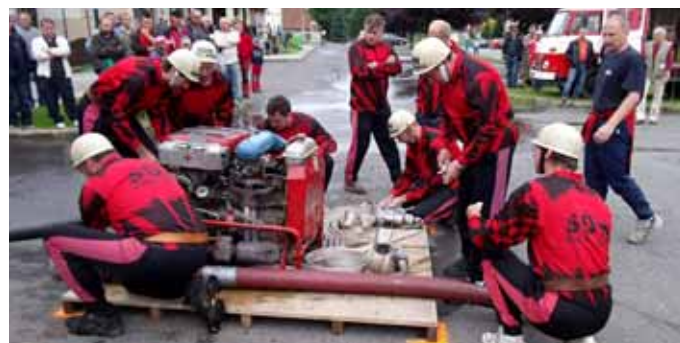
Soutěž o Putovní pohár Cyrila a Metoděje 2011