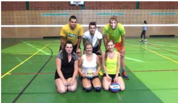
1. místo – Mimoni