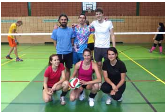
2. místo – Vzhůru dolů