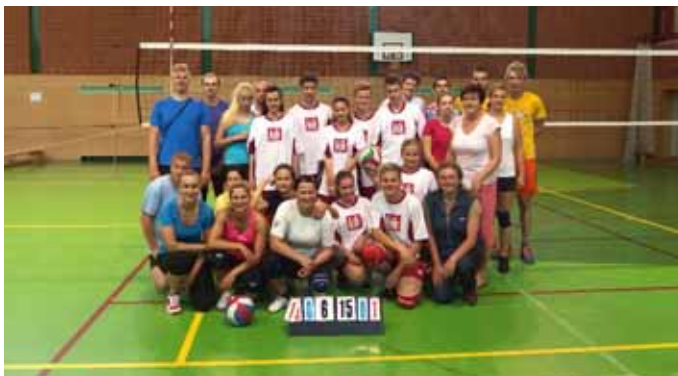
Družstva po zahájení

Text: Marie Němcová